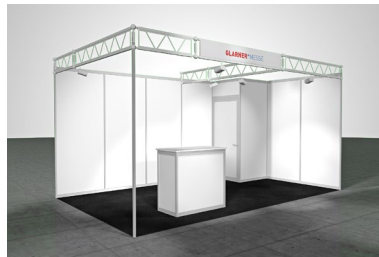
Modul «COMFORT», CHF 118.-/m 2

Wandelemente Dünnspon weiss, Bauhöhe 250 cm Rollenteppich rot, blau, grau oder anthrazit Gitterträger Chrom, UK 250 cm, OK 275 cm Blendentafel weiss 200 x 30 cm, inkl. Beschriftung (max. 20 Buchstaben) Beleuchtung 25 W Niedervoltspot, 1 Stück pro 3 m 2 Transport, Montage, Demontage exkl. Standfläche