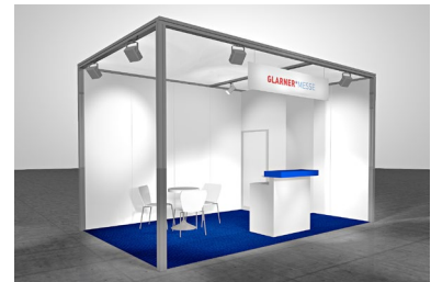
Modul «PRESTIGE», CHF 168.-/m 2

Wandelemente Dünnspon weiss, Bauhöhe 250 cm Rollenteppich rot, blau, grau oder anthrazit Gitterträger Chrom, UK 250 cm, OK 275 cm Blendentafel weiss 200 x 30 cm, mit Ihrem Logo Beleuchtung 25 W Niedervoltspot, 1 Stück pro 3 m 2 Kabine 1 m 2 , mit Türe abschliessbar Theke weiss, 103 x 53 cm, Höhe 110 cm, 1 Stück Transport, Montage, Demontage exkl. Standfläche